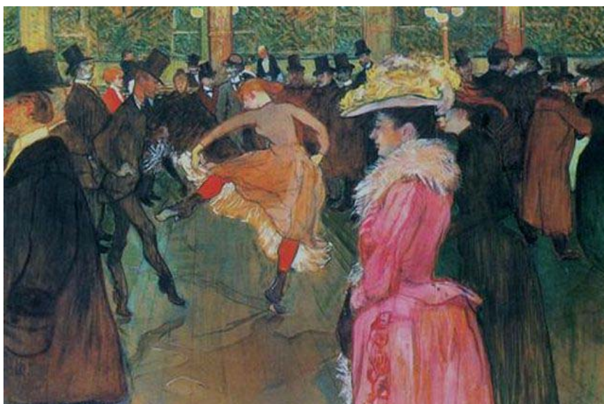
Рис. 2. Анри де Тулуз-Лотрек. Танец в Мулен Руж. 1890