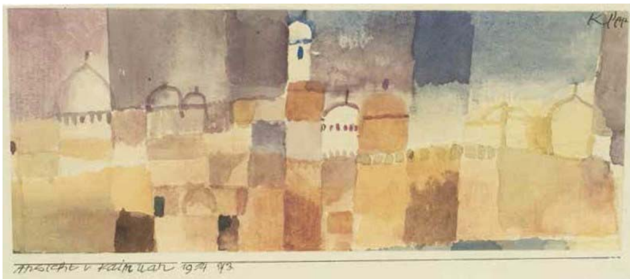
Рис. 1. Пауль Клее. Вид на Кайруан. 1914

Смотрим книгу репродукций Пауля Клее с его биографией, пациент замечает, что с двадцати лет и все следующее десятилетие художнику было плохо. Его картины были тяжелые, мрачные. В тридцать ему стало гораздо лучше, в живописи появилось больше красок и радости. (Проекция своей сегодняшней жизни и преисполненный надежд взгляд в будущее?) Вместе придумываем историю на основе картины «Вид на Кайруан», которую выбрал Б.